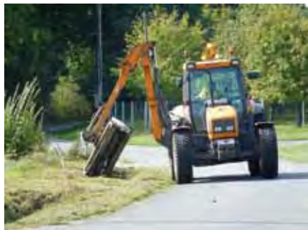
Passage de l'élagueuse pour l'entretien des accotements et fossés

Gérard DIVET est spécialement affecté à l'entretien des accotements et fossés de la commune qui compte 86 km de routes et 92 km de chemins ruraux. En dehors de la période de coupe, il participe aux autres travaux, notamment la voirie par la conduite de poids lourd.