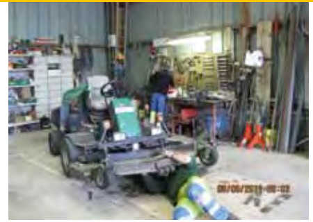
Entretien du matériel