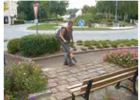
Propreté des espaces, passage du souffleur