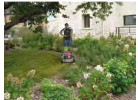
Tonte des pelouses