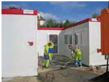
Application d'enrobé près de la nouvelle classe mobile à l'école La Roche des Grées