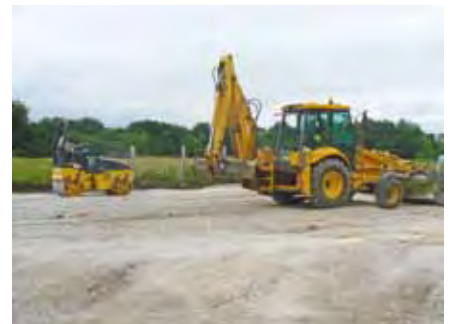
Intervention du Service avec Tractopelle et cylindre à la Plateforme des déchets verts à Tréguiily pour remise en état du sol avant l'hiver