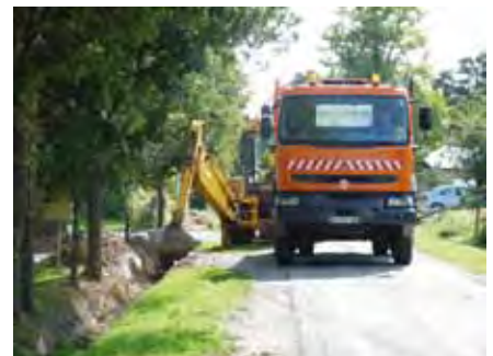
Curage de fossés avec tractopelle et camion pour l'évacuation de la terre